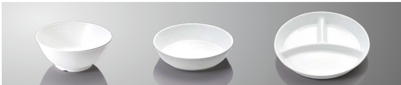
JT13WP 13cmボール 129×54(360ml)〈80入〉 ¥890