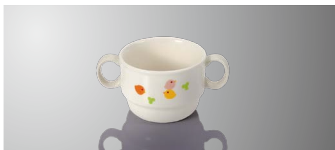
JT64TH 両手付きカップ 129×86×61(215ml)〈45入〉 ¥1,300