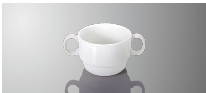
JT4WP 両手付きカップ 129×86×61(215ml)〈45入〉 ¥1,100